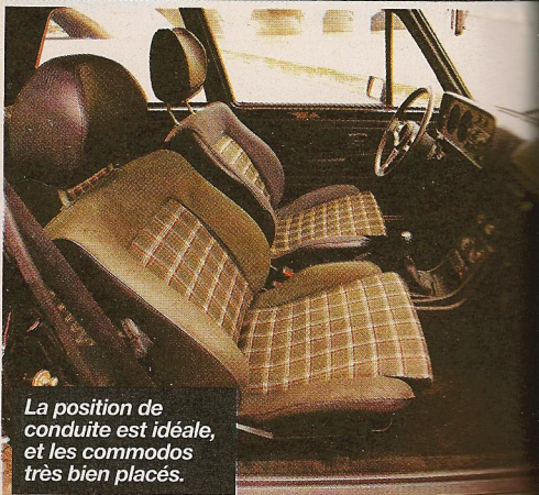
La position de conduite est idéale, et les commodos très bien placés.