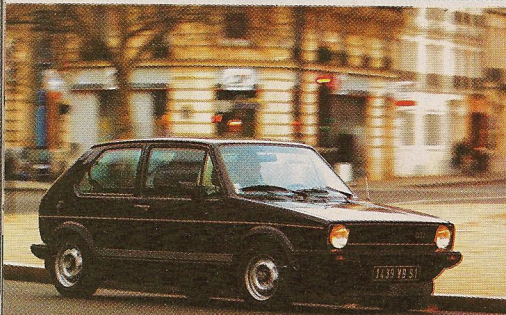
Dans les années 80, 110 ch suffisaient pour "s'éclater".

La Golf GTI fut à l'origine d'un nouveau type d'auto : la compacte sportive. Trente ans après, elle suscite toujours l'enthousiasme !