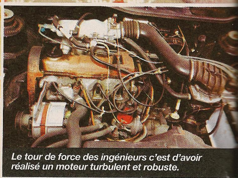
Le tour de force des ingénieurs c'est d'avoir réalisé un moteur turbulent et robuste.