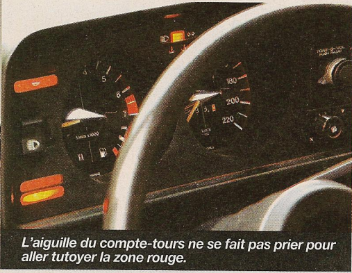
L'aiguille du compte-tours ne se fait pas prier pour aller tutoyer la zone rouge.