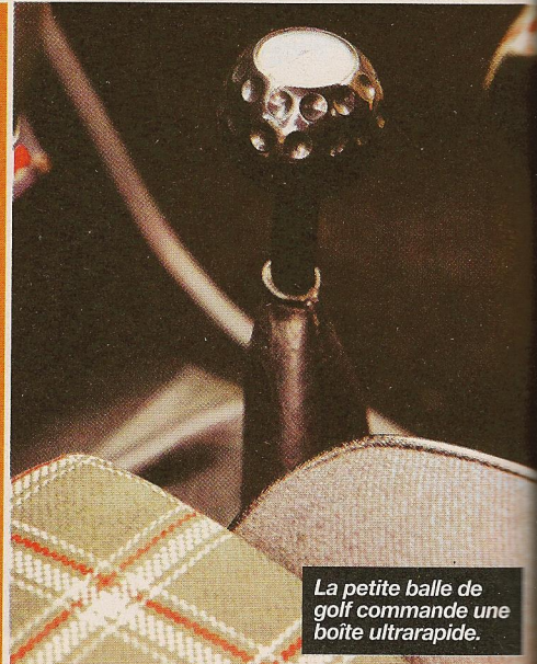
La petite balle de golf commande une boîte ultrarapide.

Jusqu'en 1982, la Golf GTI est exclusivement disponible en 3 portes.